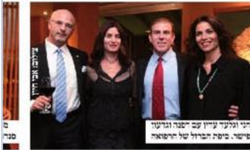
ס ס ס